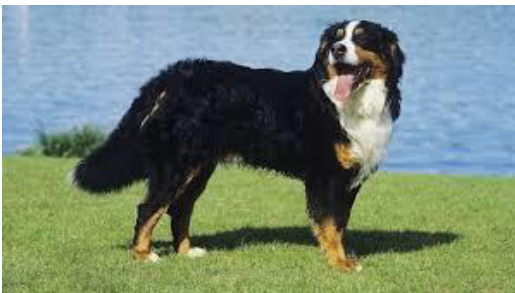
Gero, Jaron und Justus - Erdmännchenklasse 4a