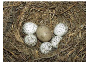
Leon und Jannik - Otterklasse 4b

Die Kuckucke sind Zugvögel und ziehen im Winter nach Afrika. Dort ziehen sie mit den Büffeln umher. Dadurch haben sie keine Zeit Nester zu bauen. Deshalb legen sie ihre Eier in fremde Nester von anderen Vögeln und sie beachten das die Eier gleich sind. Sobald die Kuckucks - Küken geschlüpft sind, schubsen sie die anderen Eier aus dem Nest. Kuckucke ernähren sich von Zecken und anderen Käfern die im Fell der Büffel stecken.